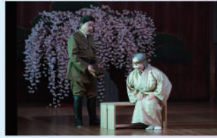
2022年 堺シティオペラ公演より

夜の公園で、ひとりの老婆が煙草の吸殻を拾っている。そこへ詩人が通りがかり、老婆に「あなたは一体誰なんです。」と問うと「むかし、小町と言われた女さ。私を美しいと言った男はみんな死にしまった...」と告げる。時空を超え、80年の時を遡り、煌びやかな鹿鳴館の舞踏会へ。