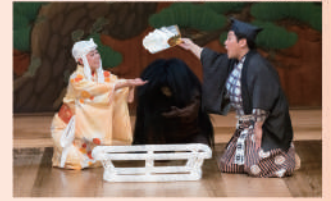
2022年 堺シティオペラ公演より

ある村に、さえないおやじとそれに不釣り合いな笑顔良しで働き者の女房が暮らしていた。そこに自慢の“赤い陣羽織”を着た女好きのお代官が横恋慕。慌てた亭主のとんだ勘違いで“赤い陣羽織”をめぐる、てんやわんやの大騒動！